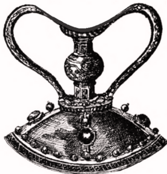
El sant Calze de València amb el recipient superior (associats al sant Sopar) i el peu i base inferiors (atribuïts a èpoques posteriors).

de Crist. En clara competència amb altres calzes que pretenen comptar amb aquesta mateixa condició, sembla que el de la seu valenciana es troba en una bona posició, malgrat totes reserves que fan dubtar de l'existència de la mítica copa. Fins a l'any 1916 es trobava a l'armari central de la capella esmentada i des d'aleshores se li va donar un protagonisme destacat.