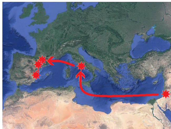
Hipotètic itinerari del sant Calze